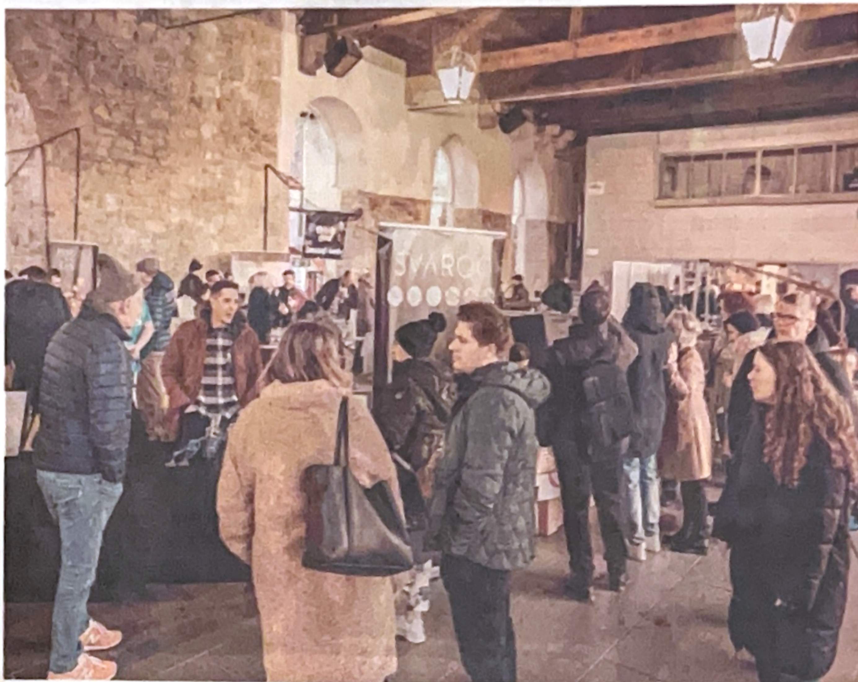
Festival žganjekuhe je v Taverno privabil veliko število obiskovalcev.

Med sadnimi likerji sta z likerjem iz črnega ribeza slavila lastnika Destilarne Yourich, gre za rusko-ukrajinski par, ki ima v lasti sadovnjak na območju